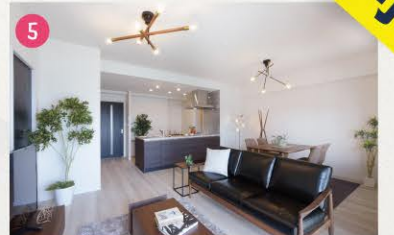
20帖超えのワイドなLDK