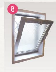
トイレ・洗面・浴室に換気窓を設置

タオルや衣類などを収納できるスペースをご用意しました。お風呂用品などのストックにも重宝します。