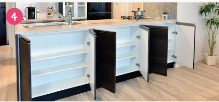
キッチンカウンターダイニング側収納

キッチンカウンターのリビング側全面を収納スペースとして活用。デスクスペースを有効活用し、普段使わない物などを入れておくことができます。