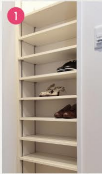
シューズクローク

C2 TYPE 3LDK | 303号室 ■生活空間面積 103.83㎡ (31.40坪) ■専有面積 80.24㎡(24.27坪) ■バルコニー面積 20.85㎡(6.30坪) ■ポーチ面積 2.74㎡(0.82坪)