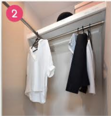
ウォークインクローゼット

奥行きもあり、上部には棚も設置してあるので、季節ものから小物まできれいに収まります。